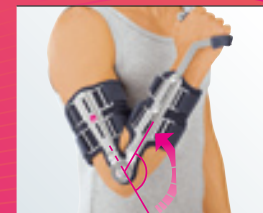
0-120° Flexion / Extension