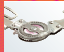
Flaches QuickSet Gelenk

Die spürbare Erleichterung in der Therapie.