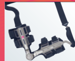
423 g Gesamtgewicht