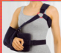
medi SAS° 15 Abduktionslagerung in 15°