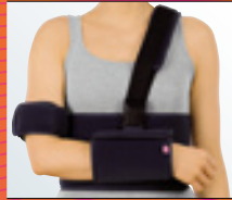
medi Arm fix Ruhigstellung in 0° Position