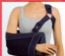
medi SAS° multi Rotationsstabile Abduktionslagerung in 15°