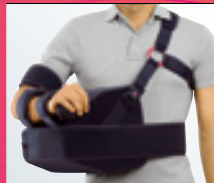
medi SAS° 45 Abduktionslagerung in 30° bis 45°

08.30 – 10.30 Uhr Hauptthema III Saal Berlin